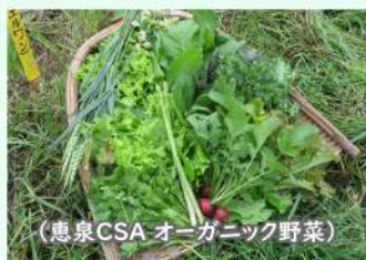
(恵泉CSA オーガニック野菜)