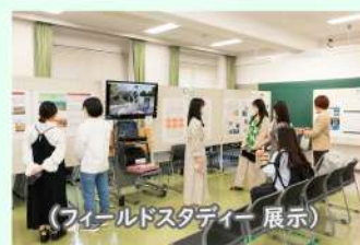
(フィールドスタディー 展示)