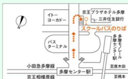
(スクールバス乗り場)

当日は、学生食堂の営業をしております。どうぞご利用ください。また、お食事は学生食堂、もしくは屋外のベンチ等でお召し上がりくださいますようご協力をお願いいたします。