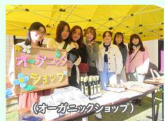
(オーガニックショップ)