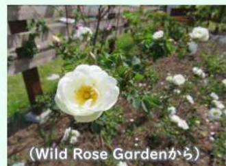
(Wild Rose Gardenから)